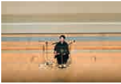
市川市文化会館 大ホール 市川市児童生徒音楽会