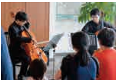
アイ・リンク45階展望施設 アイ・リンクスカイコンサート