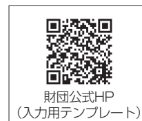
財団公式HP (入力用テンプレート)