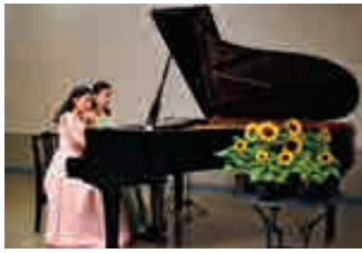
市川市文化会館 大会議室 ひまわりコンサート