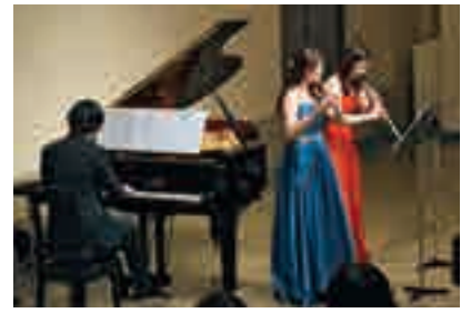
市川市文化会館 大会議室 午後のクラシック