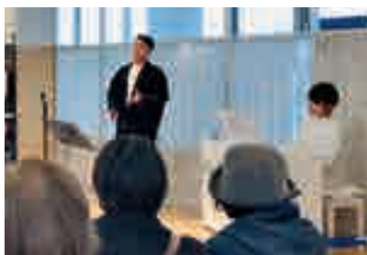
道の駅いちかわ 道の駅いちかわコンサート