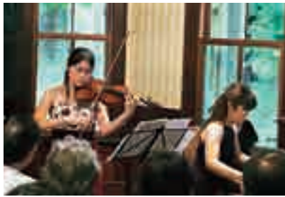
木内ギャラリー てこの森 木内邸音楽会