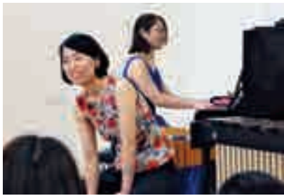
芳澤ガーデンギャラリー 芳澤こどもコンサート