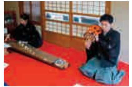
郭沫若記念館 邦楽コンサート