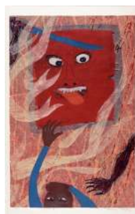
日本の鬼 / 高木志朗 (1968)