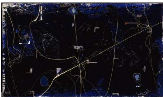
BLUE / 小野忠弘 (1993)