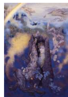
夢と覚醒 / 工藤甲人 (1971)