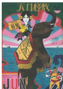
天井棧敷定期会員募集 デザイン：横尾忠則 (1967)