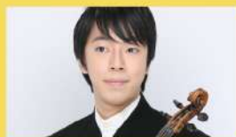
ヴァイオリン/倉富亮太 (NHK交響楽団次席)