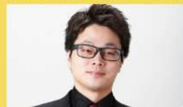
ヴィオラ/千原正裕 (新日本フィルハーモニー交響楽団フォアシュビラー)