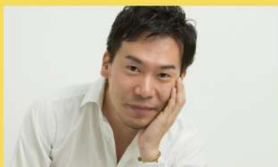
プロジェクトリーダー/福川伸陽 (ホルン・元NHK交響楽団首席)