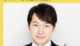
フルート/神田勇哉 (東京フィルハーモニー交響楽団首席)