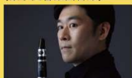
クラリネット/松本健司 (NHK交響楽団首席)