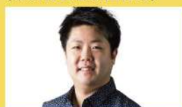
トランペット/長谷川智之 (NHK交響楽団首席)